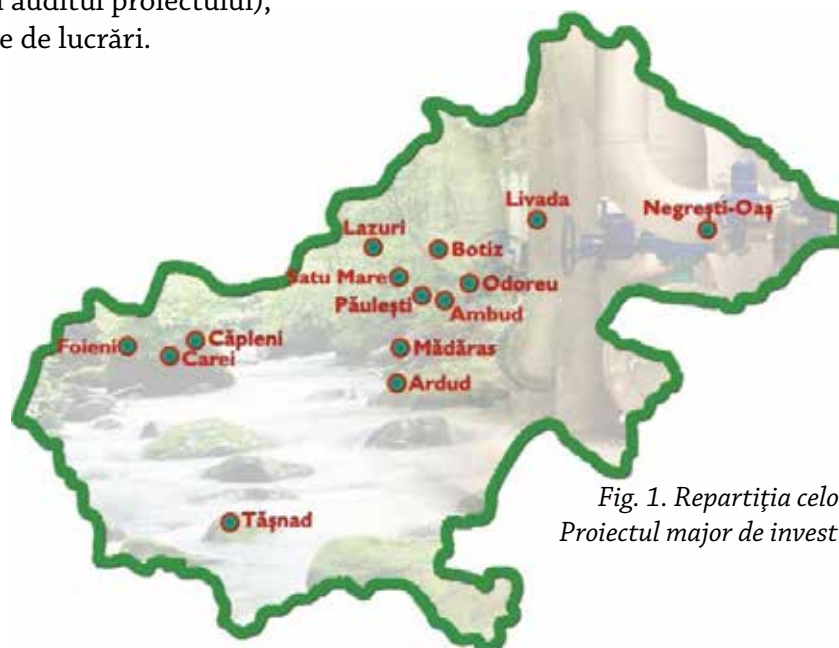
Fig. 1. Repartiția celor 14 localități implicate în Proiectul major de investiții din județul Satu Mare.